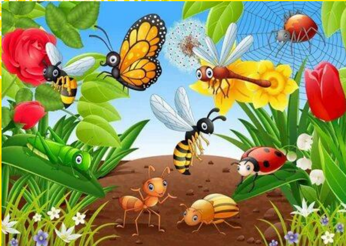
Фото отчет летнего проекта «На лесной полянке» Группы «Светлячки»